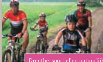
Drenthe; sportief en natuurlijk!