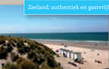
Zeeland; authentiek en gastvrij!