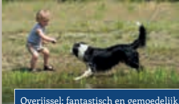
Overijssel; fantastisch en gemoedelijk!