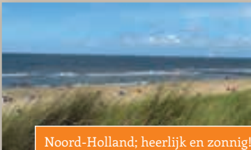
Noord-Holland; heerlijk en zonnig!