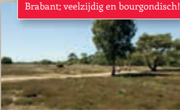
Brabant; veelzijdig en bourgondisch!