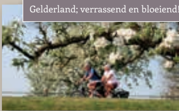
Gelderland; verrassend en bloeiend!