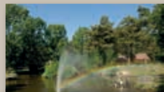
Limburg; onvergetelijk en mooi!